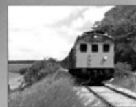
Et sommerportræt af Mariager - Handest Veteranjernbane