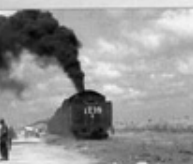
3. Ferrocarriles de Cuba