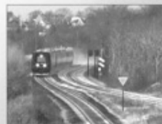
Farvel DSB & Goddag Arriva