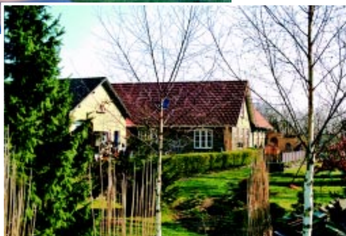
Uggerslev station. Det er rejsestalden til venstre.