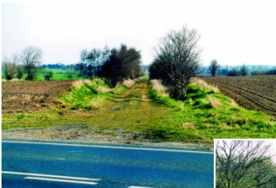
Markvej hvor banen gik mellem Beldringe og Lunde