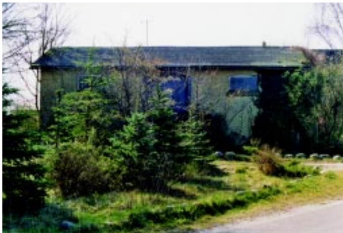
I junglen omkring Jullerup station gemmer pakhuset sig.

Banen kørte nu i næsten nordvestlig retning og et par km vest for Jullerup kan man ved Havredalgård genfinde banen i form af