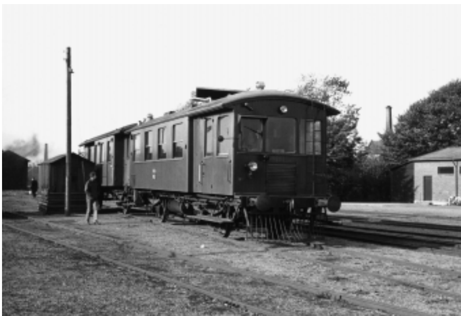
Herunder: NFJ Mg 7 i Bogense, den 11 oktober 1964.