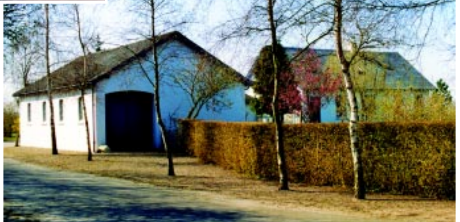
Guldbjerg station med rejsestalden til venstre.