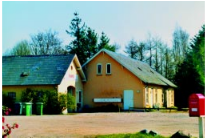
Skamby station. Antallet af ungdomslejligheder fremgår af rækken af postkasser på gavlen.

tet til ungdomslejligheder, men man har stadig fundet det passende at vedligeholde navneskiltet. Så på gavlen over rejsestaldens port kan man stadig se både i mil og km, hvor langt der er til Bogense hhv. Odense. Her var et enkelt læsse-/krydsningsspor, men stationsområdet henligger i dag helt øde. Sidesporet til „Fyns Andels Foderstofforening“, som lå på den anden side af landevejen i vestenden, kan man ikke finde mere.