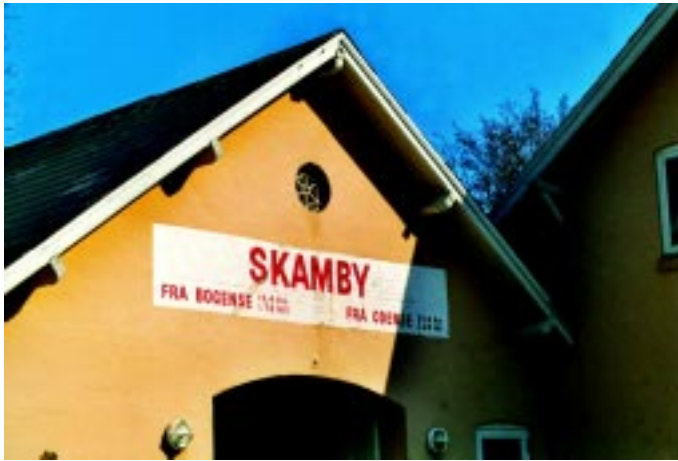
Nymalet stationsskilt på porten til rejsestalden på Skamby station.