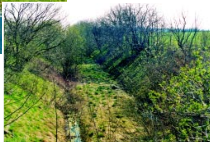
Gennemskæring ved den tidligere bro syd for Rostrup

en markvej på en lav dæmning. Videre gik det mod nordvest syd om landsbyen Ejlbj, der aldrig fik hverken station eller trinbræt, men måtte nøjes med et læssespor til roetransporterne.