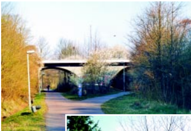
Viadukten for Stadionvej i Odense. Hertil fulgtes OMB og NFJ ad, hvorefter NFJ drejede mod nord til højre.

Det er i øvrigt i dag ikke muligt at genfinde banen mellem Kappendrup og Uggerslev, men midt mellem Uggerslev og Skamby kan man til gengæld tage en afstikker ned ad endnu en ujævn markvej, der følger banen. Belønningen kommer for enden af markvejen i form af en smukt istandsat SKAMBY station (km 24,7). I dag er bygningen indret-