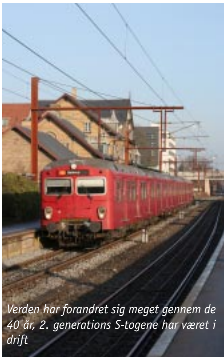
Verden har forandret sig meget gennem de 40 år, 2. generations S-togene har været i drift

Dette hæfte er produceret i samarbejde mellem Dansk Jernbane-Klub og DSB S-tog A/S i 2007. Hæftet er redigeret af Thomas Nørgaard Olesen. Copyright 2007 Dansk Jernbane-Klub, www.djk.com