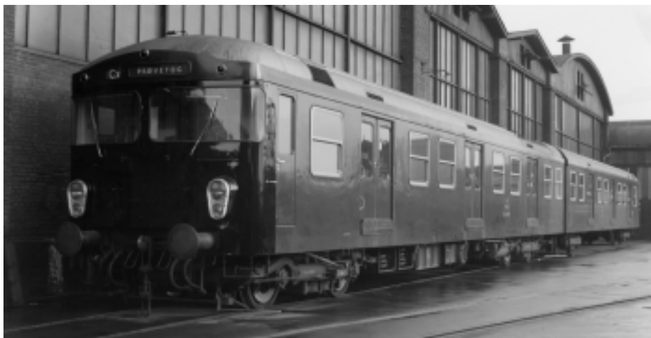
Splinternyt 2. generations S-tog i fabriksgården hos Frichs i Århus