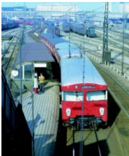
Nyleveret 2. generations S-tog ved Dybbølsbro omkring 1970. Togenes fronter blev ændret med bl. a. nye ruder midt i 80-erne

takstsystem for al kollektiv transport i hovedstadsområdet.