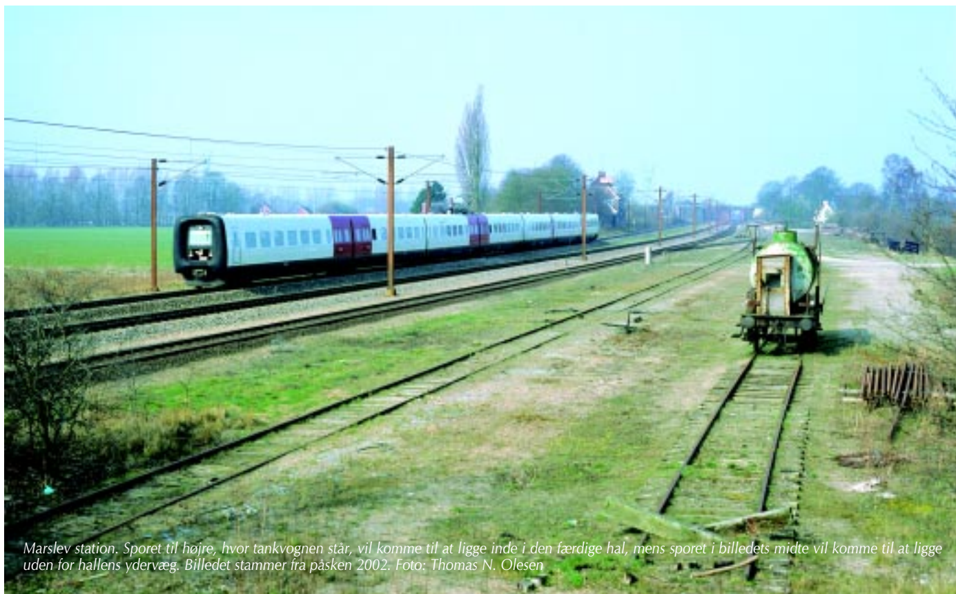
Marslev station. Sporet til højre, hvor tankvognen står, vil komme til at ligge inde i den færdige hal, mens sporet i billedets midte vil komme til at ligge uden for hallens ydervæg. Billedet stammer fra påsken 2002.