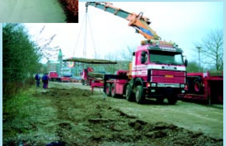
Til højre: Læsning af sporrammer på lastbil.