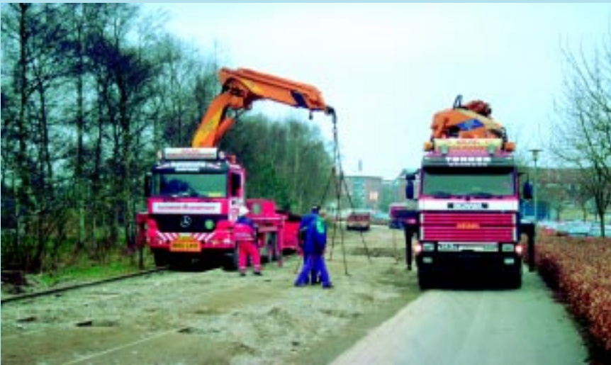
Til venstret: Efter gravning af huller - fire pr. sporramme - blev sporrammerne trukket op gennem gruslaget med kran.